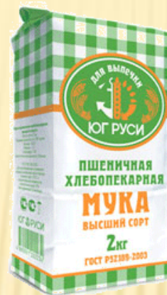
Мука пшеничная Высший сорт 2 кг