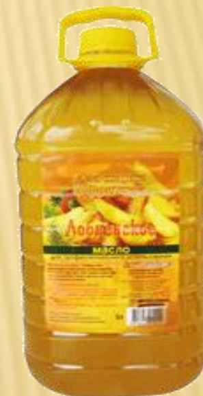
Фритюрное Подсолнечное масло 5 л