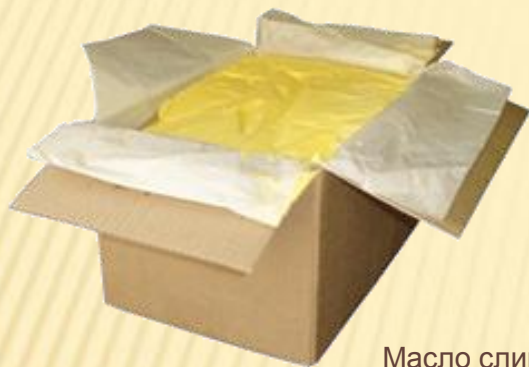
Масло сливочное Монолит 10 кг и 20 кг