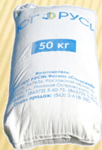
Мука пшеничная Высший сорт 50 кг